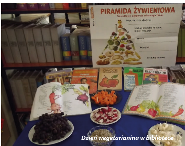
Dzień wegetarianina w bibliotece