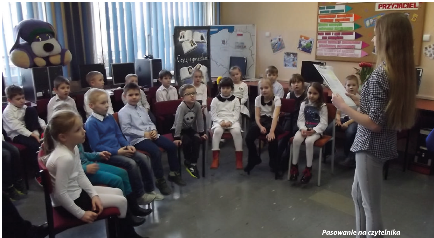
Pasowanie na czytelnika