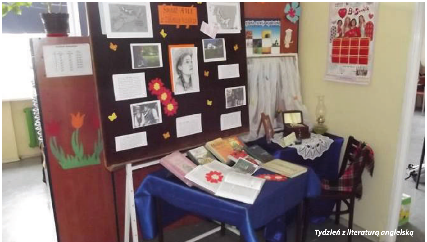
Tydzień z literaturą angielską

W opinii pań biblioteki od lat zmieniają swój wizerunek oraz kierunek działań. Aby pozyskiwać nowych czytelników, bibliotekarze muszą podejmować wiele nowatorskich i skutecznych działań popularyzujących książkę i czytelnictwo.