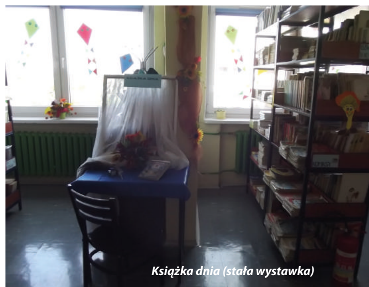
Książka dnia (stała wystawka)